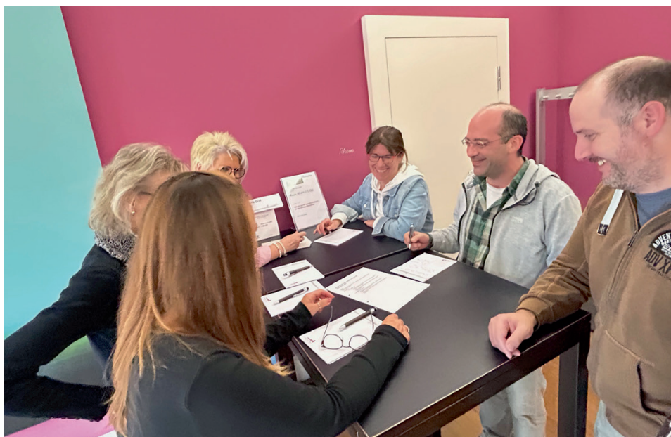
Workshop Optimierung Geschäftsprozesse, 28.10.2024, Boppard