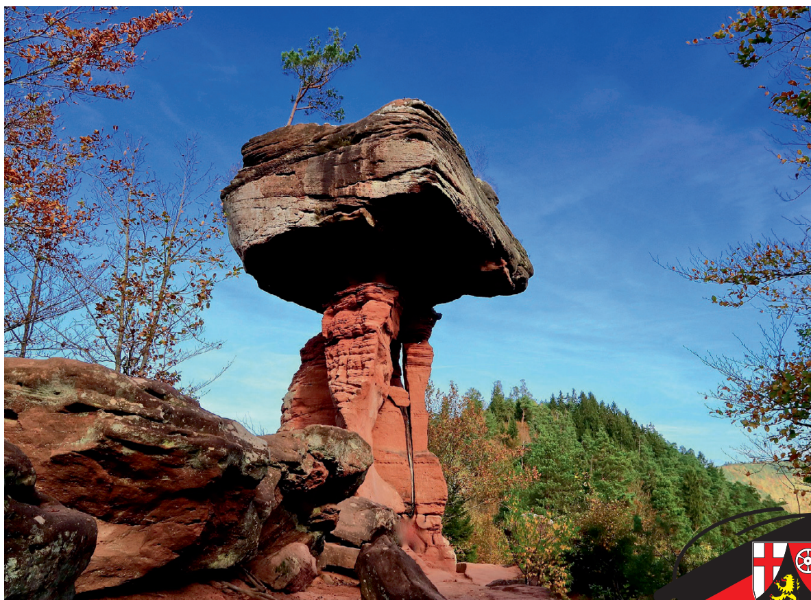
© Teufelstisch in Hinterweidenthal von HaFu1961 auf Pixabay

Das Magazin des Fachverbands der Kommunalkassenverwalter Landesverband Rheinland-Pfalz e.V.